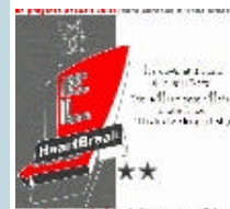
Milano Flash Art Fair