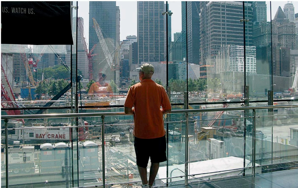
2011 VISTA DO FINANCIAL CENTER SOBRE O TERRENO DO GROUND ZERO