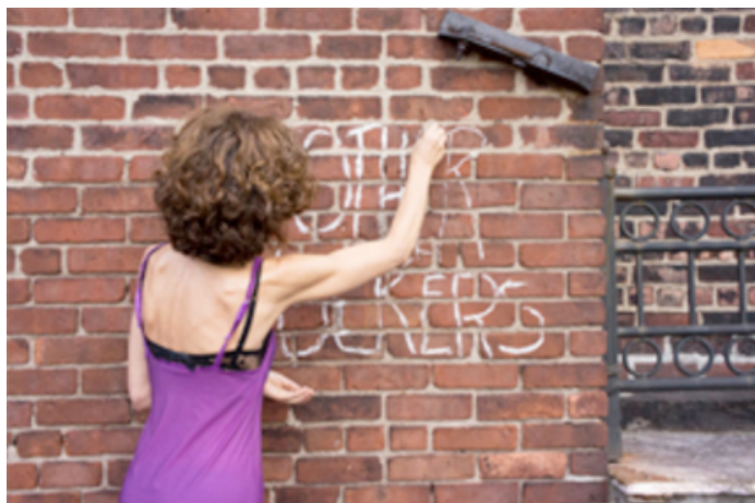
© Rita Barros, Displacement 2 , Motherfuckers #7

Inaugurou na passada sexta feira a exposição Displacement 2 , de Rita Barros, na Loja da Atalaia Apolónia, Lisboa. Ficando patente ao público até 15 de abril próximo, é uma exposição que surge para observar a irreverência da fotógrafa, no contexto da sua história de vida em Nova Iorque. Recordando que Barros vive, desde 1984, no Chelsea Hotel em Nova Iorque, espaço indissociável da cena underground nova-iorquina desde as décadas de sessenta e setenta.